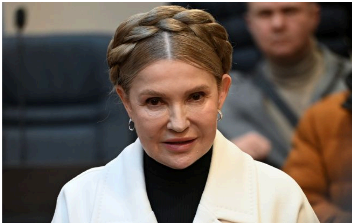
Юлія Тимошенко