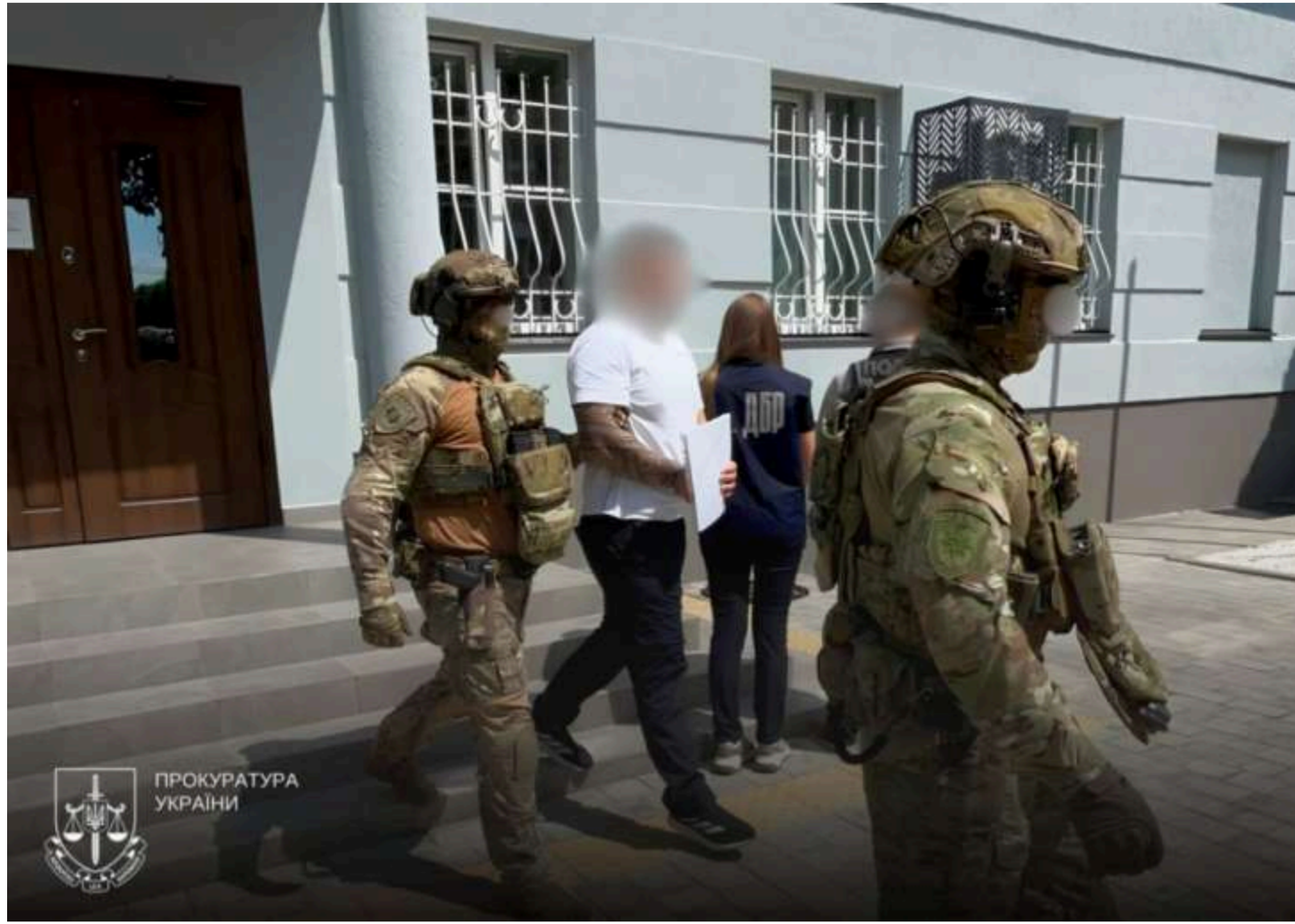
Фото: Посадовці Ужгородського РТЦК

На Закарпатті посадовцям РТЦК - керівнику одного з районних ТЦК та СП на Закарпатті, начальнику підрозділу військового обліку та інструктору - повідомили про підозру через незаконне утримання людей до 48 діб. Про це повідомив Офіс Генпрокурора.