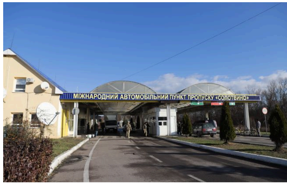
Фото: Пункт пропуску "Солотвино - Сігету-Мармацей"

Не витрачай час на шум! Читай тільки суть з РБК-Україна у Google