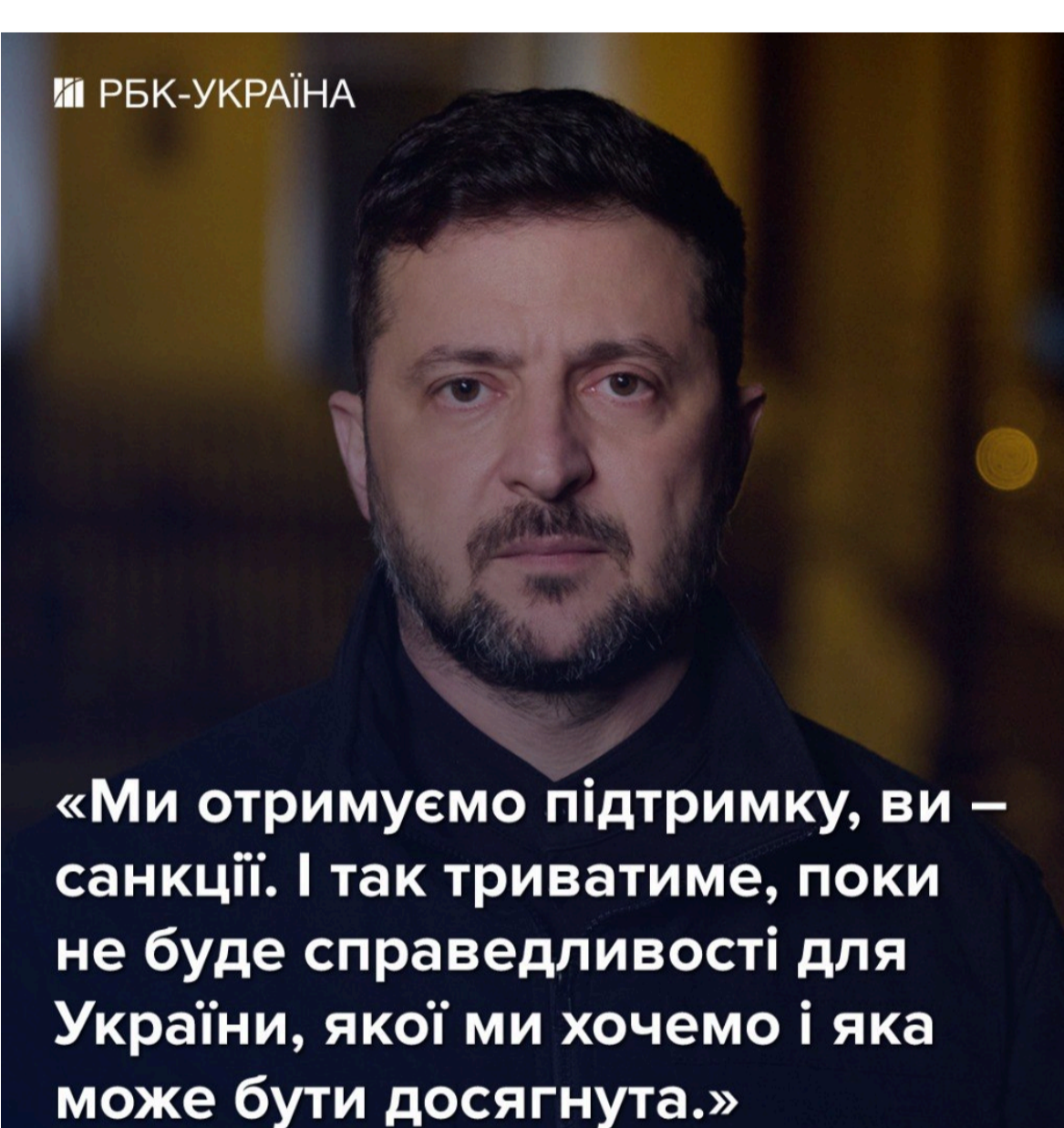
Фото: Зеленський у листі дав зрозуміти агресору, що Київ здатний різко збільшити ціну на війну для Москви (інфографіка РБК-Україна)

Очільник МЗС України Андрій Сибіга заявив, що листа передадуть всіма дипломатичними каналами . А джерело РБК-Україна в команді президента акцентувало на важливості того, що зміст листа йде в Росію, "насамперед до тих груп там, які мають вплив".