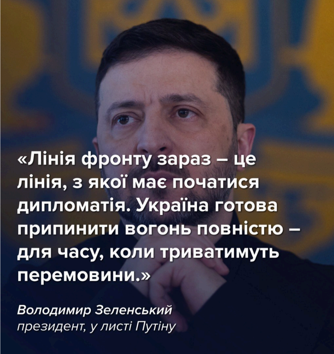
Зеленський у відкритому листі до Путіна, в якому запропонував припинення вогню (інфографіка РБК-Україна)

А вже вчора ввечері з'явився відкритий лист президента України до Путіна.