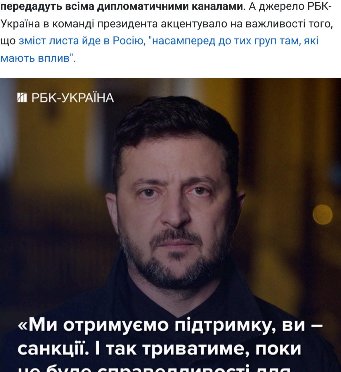
Зеленський у листі дав зрозуміти агресору, що Київ здатний різко збільшити ціну на війну для Москви

Очільник МЗС України Андрій Сибіга заявив, що листа передадуть всіма дипломатичними каналами . А джерело РБК-Україна в команді президента акцентувало на важливості того, що зміст листа йде в Росію, "насамперед до тих груп там, які мають вплив".