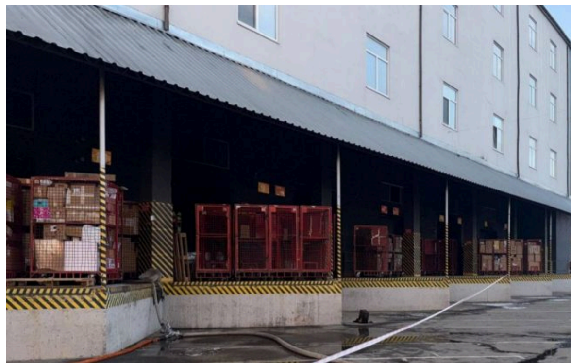
Фото: слідчі СБУ відкрили кримінальне провадження