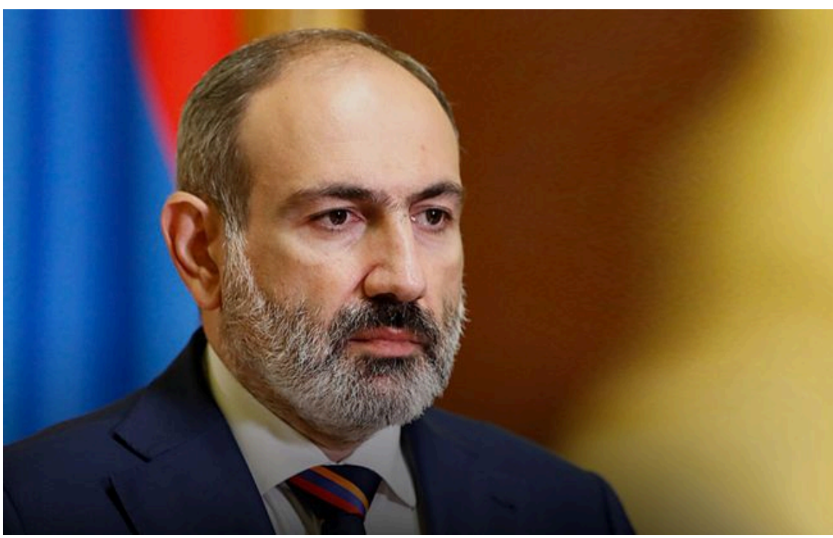
Фото: прем'єр-міністр Вірменії Нікол Пашинян (Getty Images)