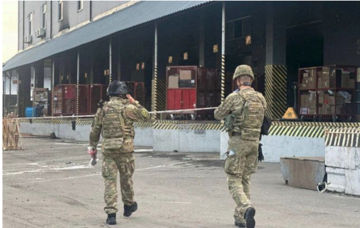
Фото: у Києві вибухнула посилка на поштовому терміналі (t.me/gunpKyiv)