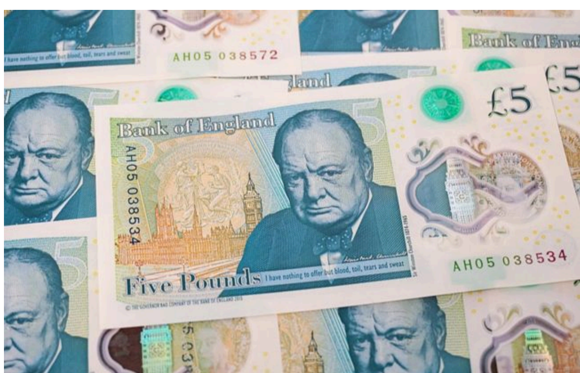
Фото: банкнота у 5 фунтів стерлінгів з портретом Черчилля

Вимкни хаос міжнародних новин! Отримуй тільки важливе з РБК-Україна у Google