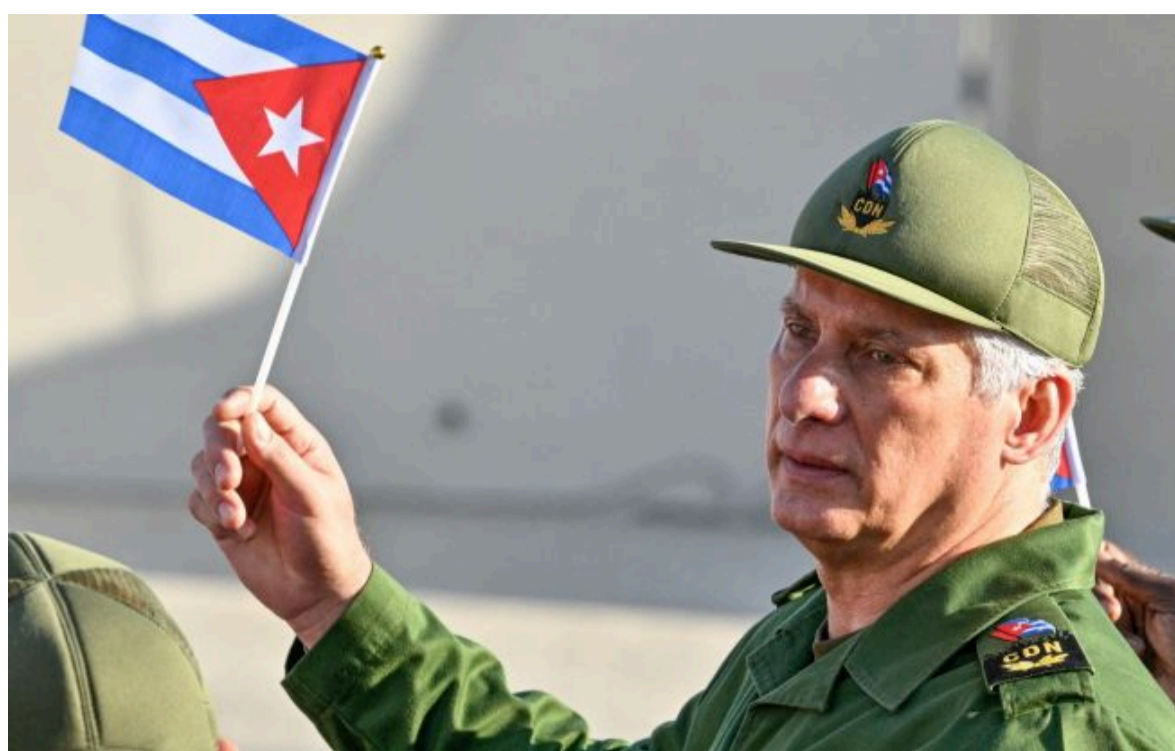
Фото: президент Куби Мігель Діас-Канель