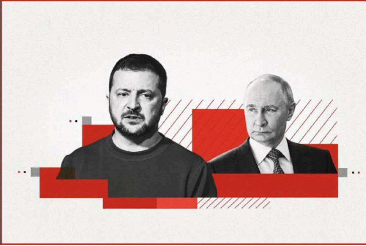
Ілюстративне фото з відкритих джерел

Президент України Володимир Зеленський опублікував відкритий лист Володимирі Путіну, в якому запропонував провести особисту зустріч для обговорення завершення війни. Він опублікований на сайті глави держави. BAGNET публікує повний текст.