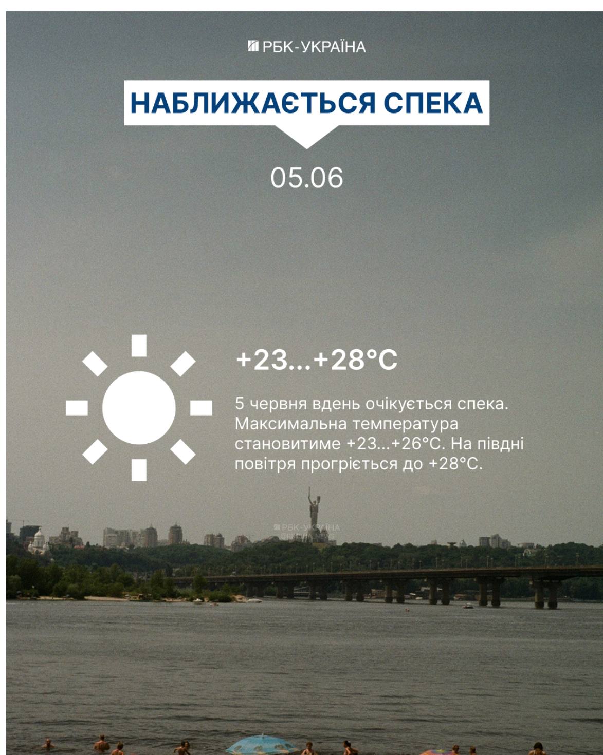
Фото: якою буде погода в Україні 5 червня (інфографіка РБК-Україна)

Читайте також: Літо в Україні розпочнеться теплою погодою: синоптик зробила оптимістичний прогноз