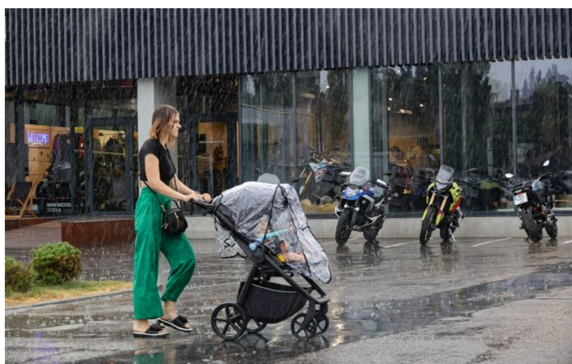
Лише в одному регіоні буде сухо: на Україну чекають "лайт-тропіки" з дощами та +28