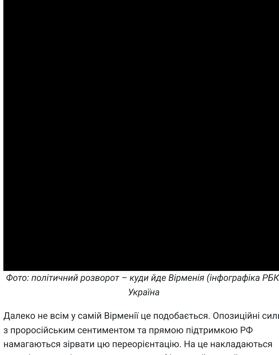
Фото: політичний розворот – куди йде Вірменія (інфографіка РБК-Україна)

Тож протягом останніх років прем'єр-міністр Нікол Пашинян планомірно розвертав країну в бік Заходу. Найбільш помітним кроком у цьому напрямку стало замороження членства Вірменії в Організації договору про колективну безпеку – російського аналога НАТО.