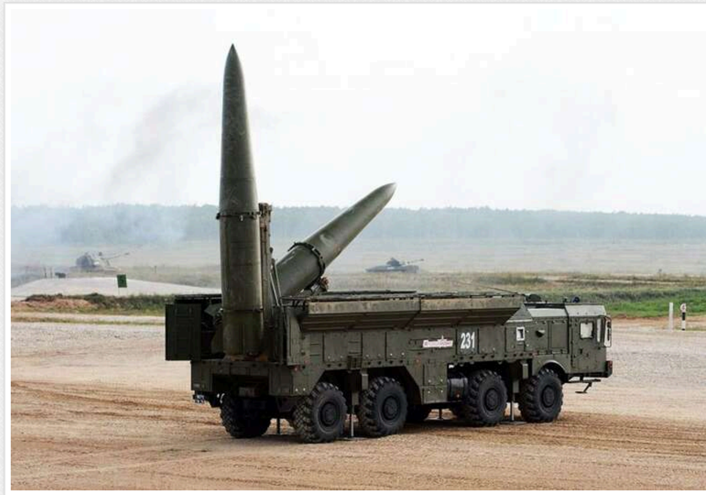
Гур: Росія може запускати до 100 балістичних ракет щомісяця, нарощуючи виробництво

Росія здатна щомісяця застосовувати до 100 балістичних ракет по Україні, зберігаючи сталий рівень їхніх запасів.