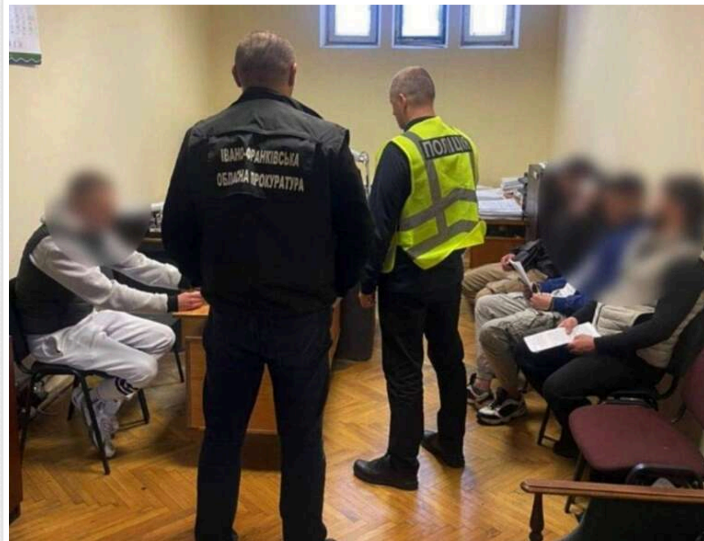
На Прикарпатті судитимуть банду кібершахраїв, які викрали з банківських карток майже 900 тисяч гривень

Кібершахрайство на майже 900 тисяч гривень: прикарпатські поліцейські скерували до суду справу організованої злочинної групи.