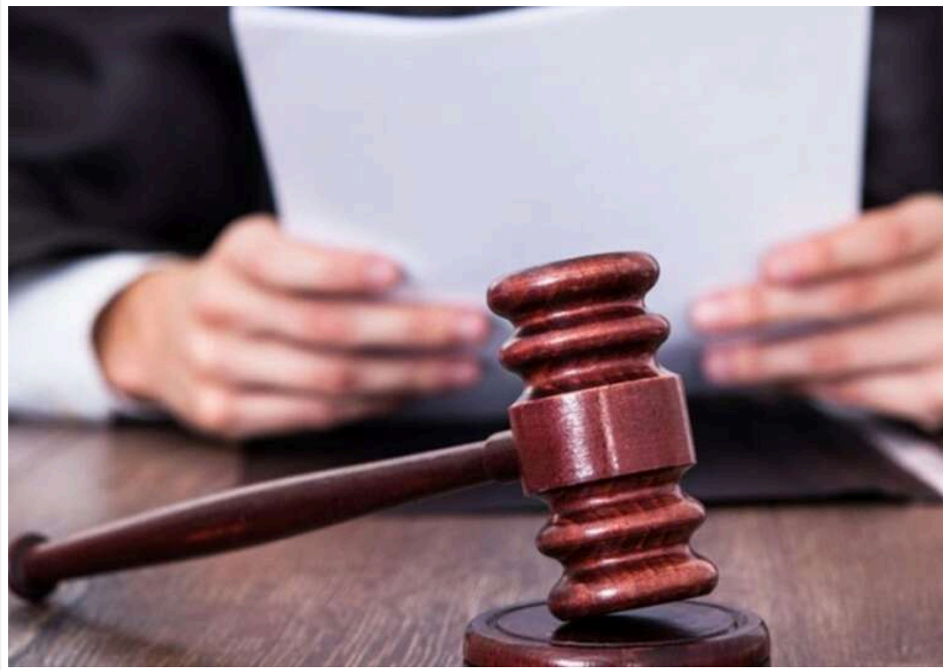
Проведе решту життя за ґратами: апеляція залишила в силі вирок ґвалтівнику 8-річної дівчинки на Харківщині

46-річний чоловік, який зґвалтував восьмирічну дівчинку на Харківщині, остаточно отримав найсуворіше покарання – довічне позбавлення волі. Подібний прецедент, коли Генеральна прокуратура домоглася максимального вироку за сексуальне насильство над дитиною, вже фіксувався в українській судовій практиці. Засуджений намагався домогтися виправдання в апеляційній інстанції, однак прокурори Харківської обласної прокуратури успішно відстояли всі аргументи сторони обвинувачення.