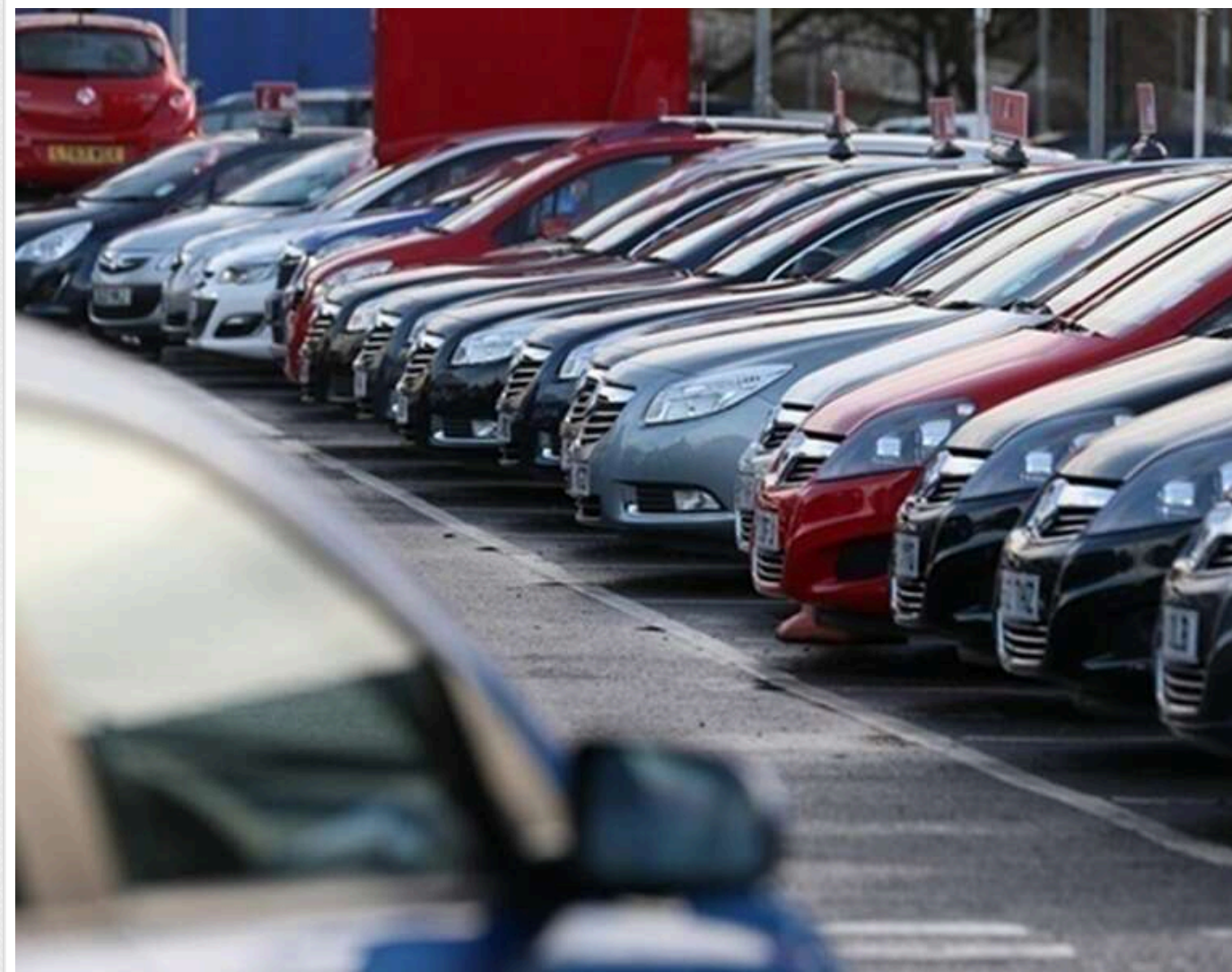
Суд оштрафував директора волинського підприємства на 440 тисяч гривень за фіктивні польські сертифікати для авто

Любомльський районний суд Волинської області притягнув директора компанії-імпортера до адміністративної відповідальності за незаконне заниження митних платежів під час розмитнення транспортних засобів.