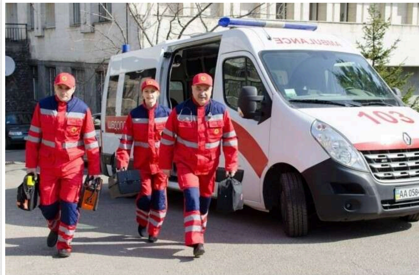
У Києві поліція розшукує чоловіка, який напав на вагітну жінку на Берестейському проспекті

У Києві на Берестейському проспекті невідомий жорстоко напав на вагітну жінку. Це черговий прояв безпричинної агресії, яка, на жаль, дедалі частіше трапляється в столиці. Лише кілька тижнів тому п'яний молодик влаштував скандал у київському супермаркеті, однак тоді його швидко затримали. Натомість цього разу нападник утік, і його досі розшукують.