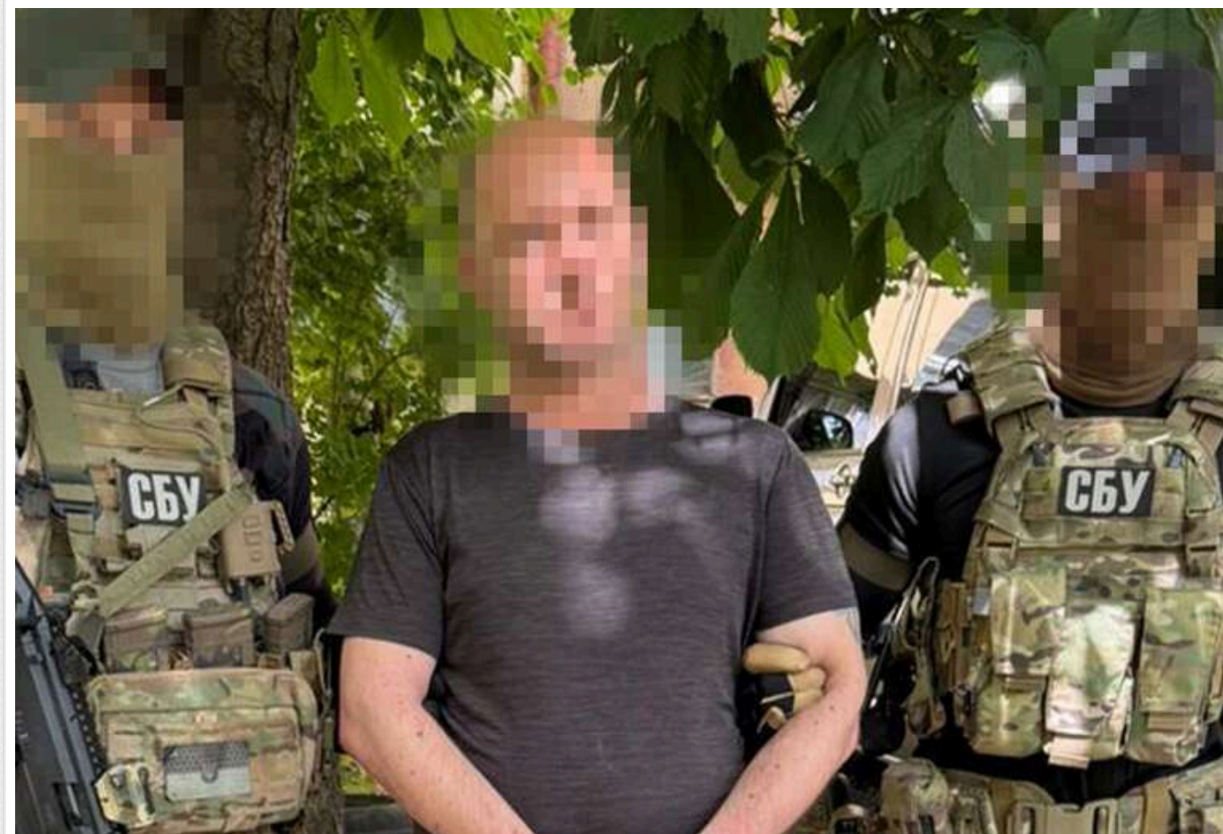
Переховувався в орендованих квартирах: У Херсоні затримали підозрюваного в держзраді залізничника

СБУ та ДБР затримали колишнього працівника Укрзалізниці, який охороняв російські військові ешелони під час окупації Херсона.