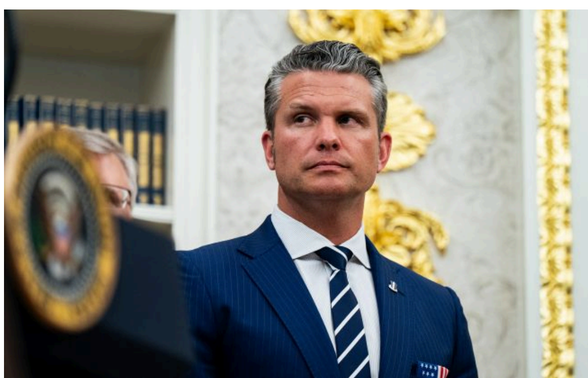
Фото: міністр війни США Піт Гегсет (Getty Images)