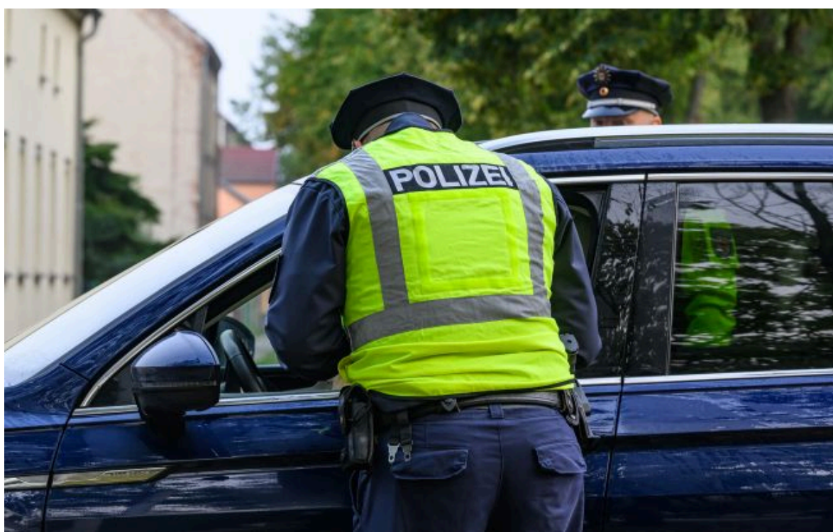
Фото: поліція у Німеччині