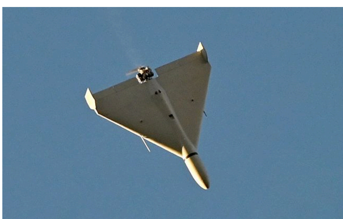
Фото: російський безпілотної типу "Шахед"