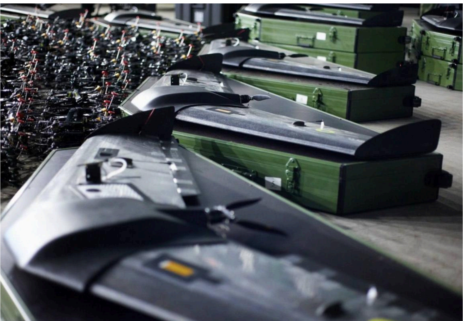
Російські зенітні дрони проти ЗСУ

Не менш важливим фактором є можливі масштаби виробництва таких апаратів у Росії.