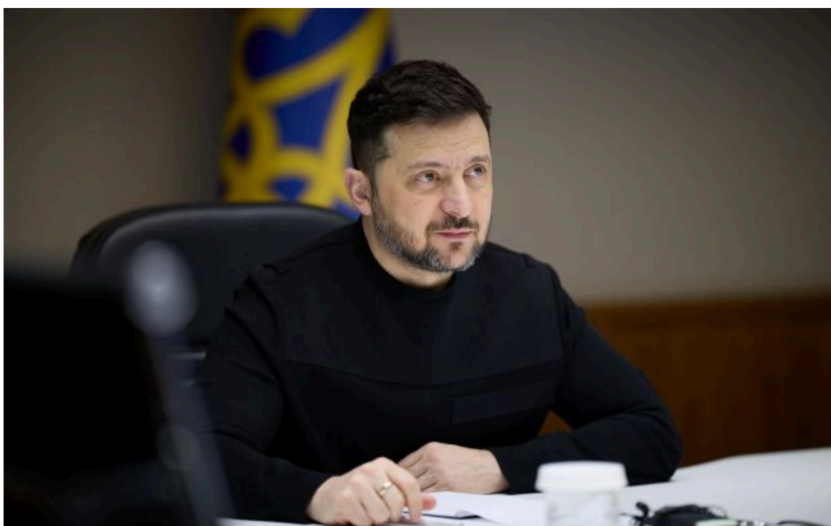
Фото: Володимир Зеленський, президент України (facebook.com/zelenskyy.official)