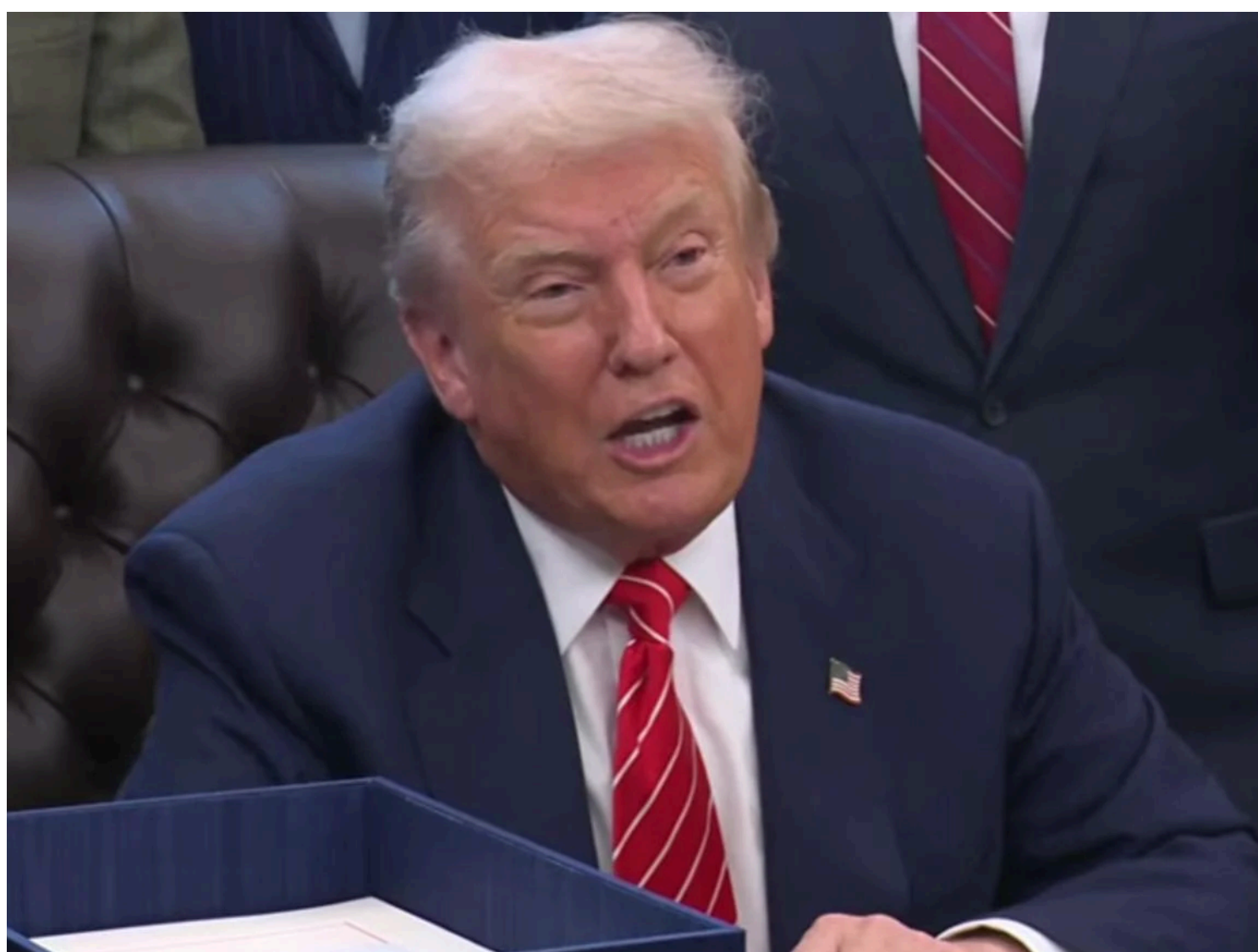
Трамп назвав опонентів "непатріотами"

Трамп розкритикував демократів та республіканців, звинувативши їх у тому, що вони ставлять політичну боротьбу вище за національні інтереси країни.