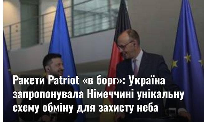
Ракети Patriot «в борі»: Україна запропонувала Німеччині унікальну схему обміну для захисту неба