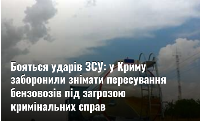
Боятися ударів ЗСУ: у Криму заборонили знімати пересування бензовозів під загрозою кримінальних справ