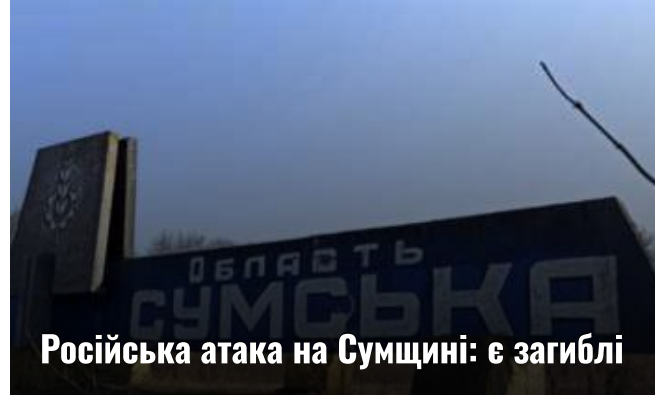
Російська атака на Сумщині: є загиблі