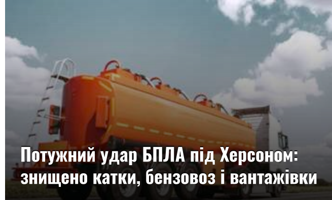
Потужний удар БПЛА під Херсоном: знищено катки, бензовоз і вантажівки