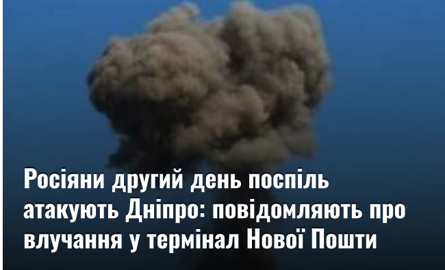
Росіяни другий день посліпль атакують Дніпро: повідомляють про влучання у термінал Нової Пошти