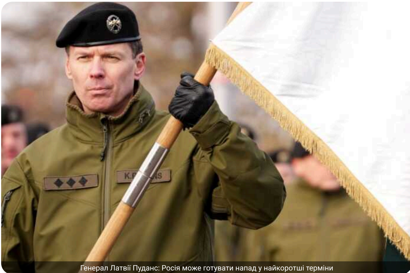
Генерал Латвії Пуданс: Росія може готувати напад у найкоротші терміни

Генерал Каспарс Пуданс, командувач Збройних сил Латвії, заявив, що Росія теоретично може здійснити атаку на країну НАТО у дуже короткі терміни, аж до «сьогодні ввечері».