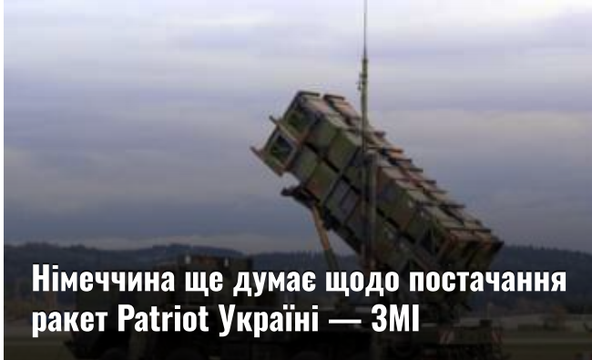
Німеччина ще думає щодо постачання ракет Patriot Україні — ЗМІ