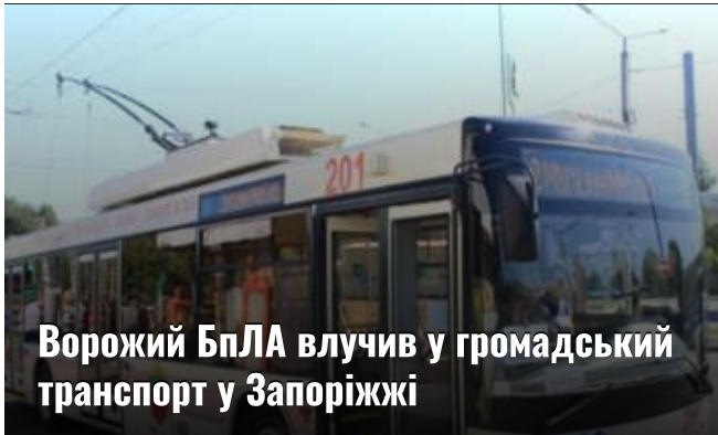
Ворожий БПЛА влучив у громадський транспорт у Запоріжжі