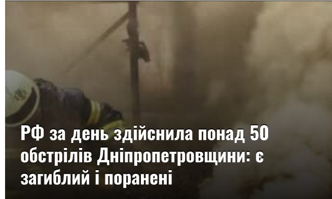
РФ за день здійснила понад 50 обстрілів Дніпропетровщини: є загиблі і поранені