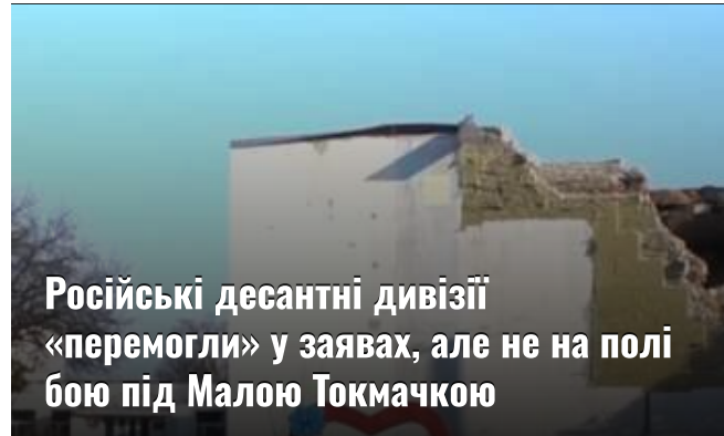
Російські десантні дивізії «перемогли» у заявах, але не на полі бою під Малою Токмачкою