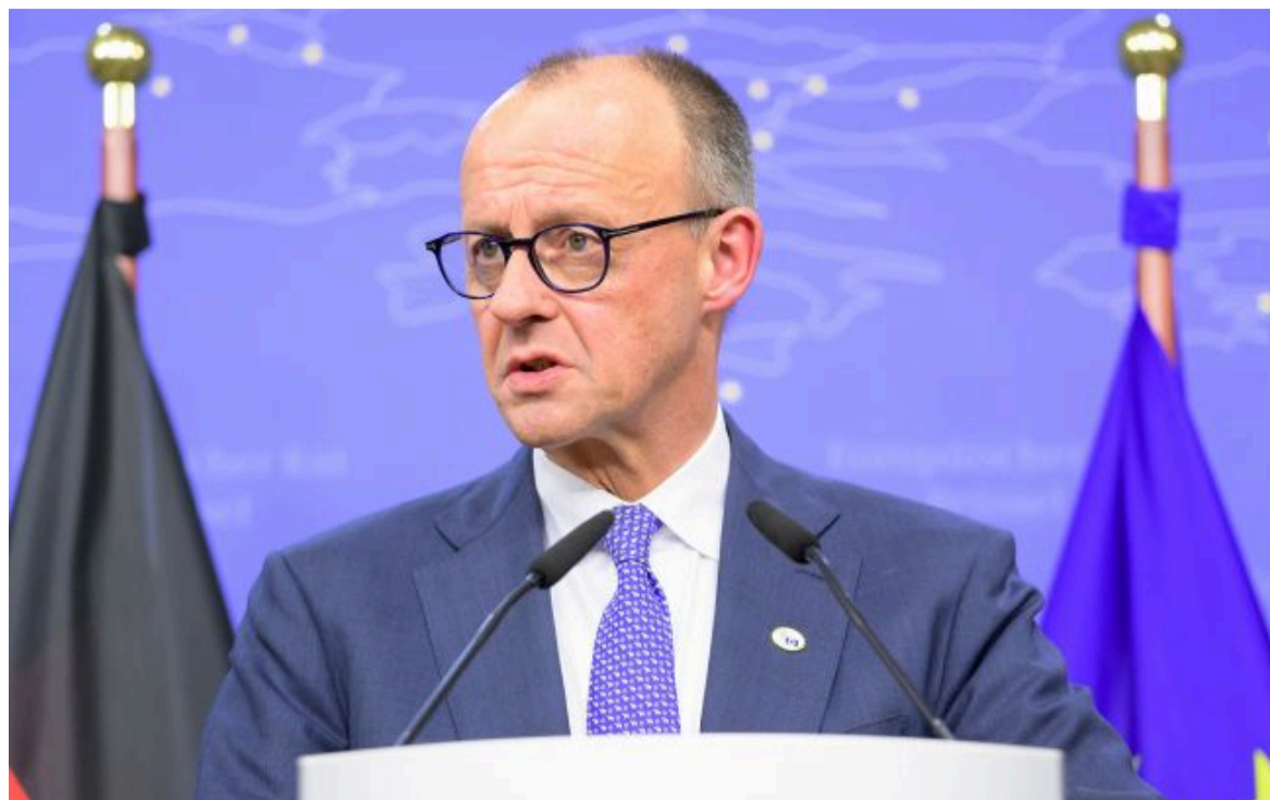
Фото: Фрідріх Мерц (Gettyimages)