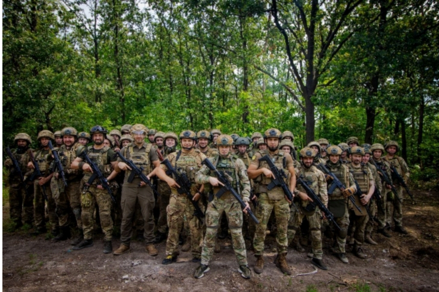
ТЕГИ: 225-й ОШП Сили оборони України Бахмут Харків Часів Яр Гуляйполе