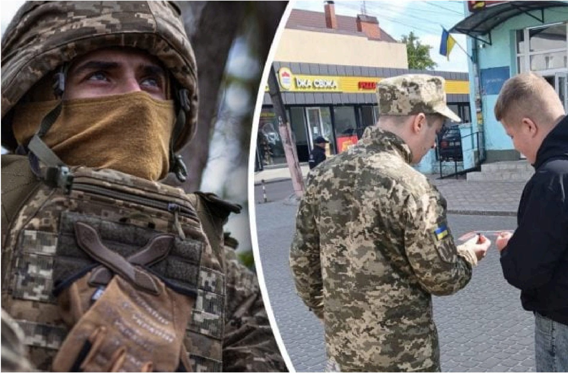
ТЦК / Фото з відкритих джерел

КАРПЕЦЬ ОЛЕКСАНДР — 04 Червня 2026, 20:22 2 Mins Read — УКРАЇНА