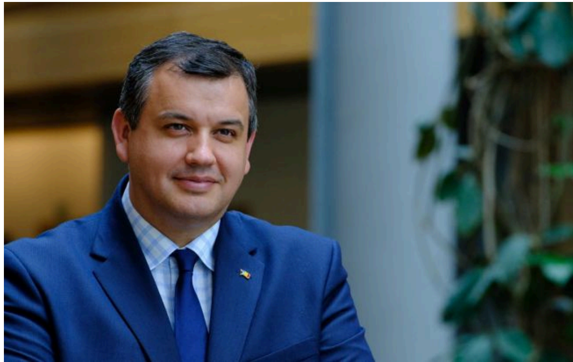
Фото: новопризначений прем'єр-міністр Румунії Еуджен Томак (facebook.com/tomaseugen)