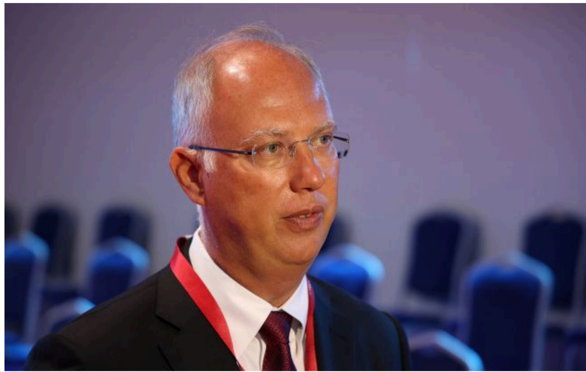
Фото: Кирило Дмитрієв (Getty Images)