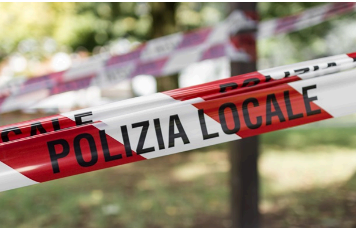
Італійська поліція розслідує жорстоке вбивство мігрантів

Правоохоронці повідомили, що затримали двох іноземців за підозрою у скоєнні численних вбивств з обтяжувальними обставинами.