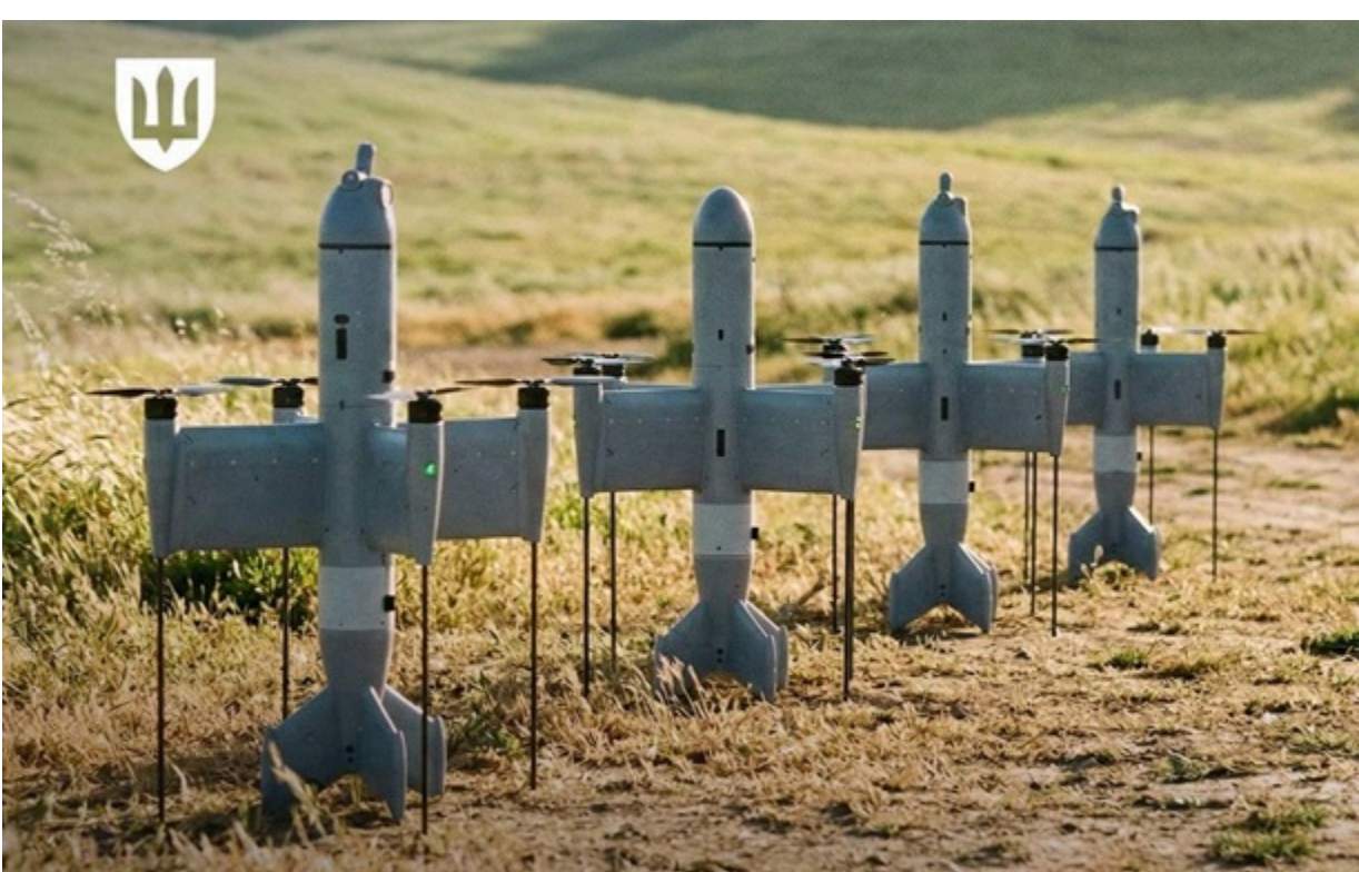
Дрони-перехоплювачі щодня нищать "шахеди"

Наразі найвищу результативність демонструє другий ешелон, за який відповідають Сили безпілотних систем.