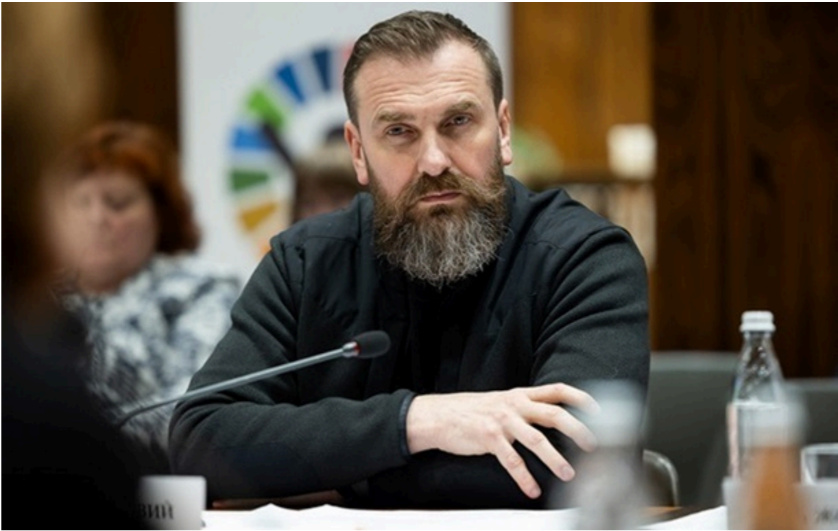
Міністр освіти і науки України Оксен Лісовий

Скасування математики - це абсурд, це не приведе до жодних позитивних змін для країни, наголосив глава Міносвіти.