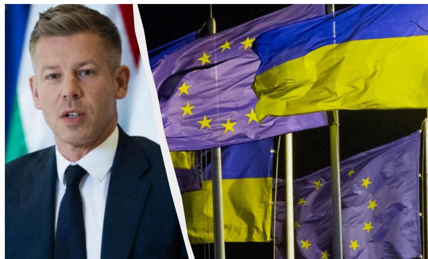
Мадяр проти пришвидшеного вступу України до ЄС

Будапешт не підтримує ідею пришвидшеного вступу України до ЄС.