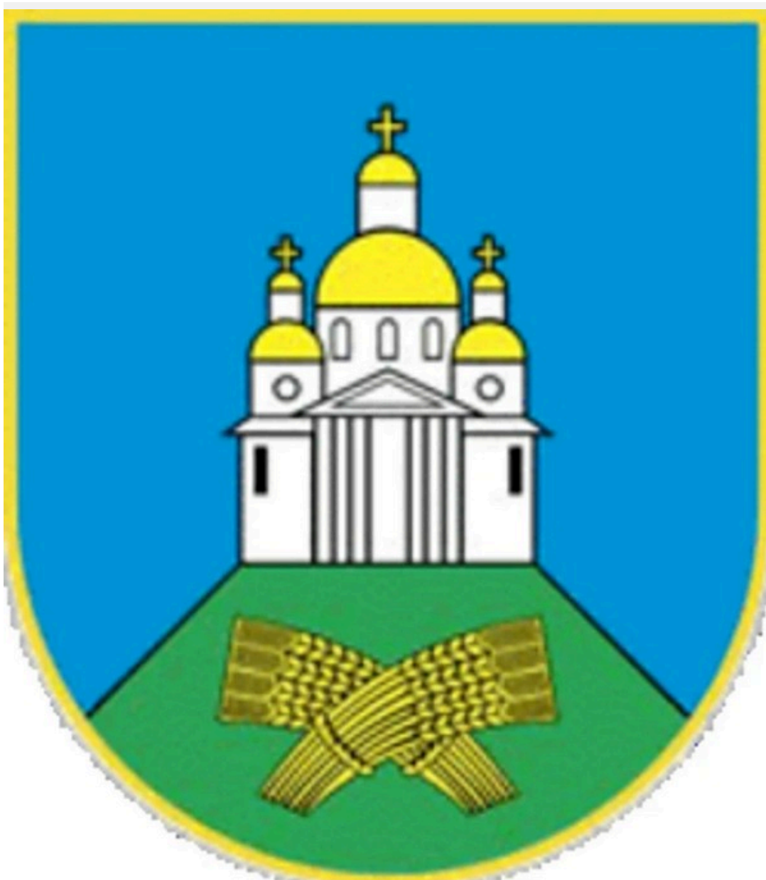
Герб Сумського району

Храм зобразили на гербі Сумського району та затвердили 31 січня 2001 року. Пам'ятка зображена на блакитному тлі, цей колір був притаманним козацьким прапорам.