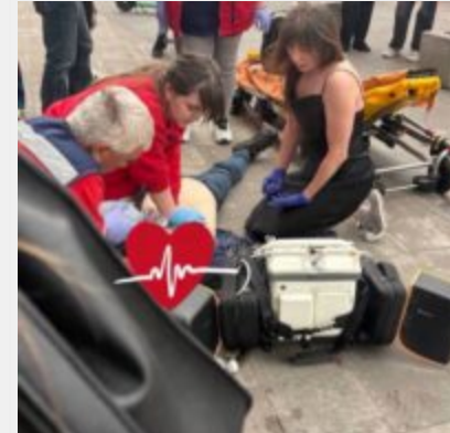
«А МИ ТУТ ПРИ ЧОМУ?». Смертельна відмова за п'ять хвилин від порятунку та ціна байдужості київської підземки