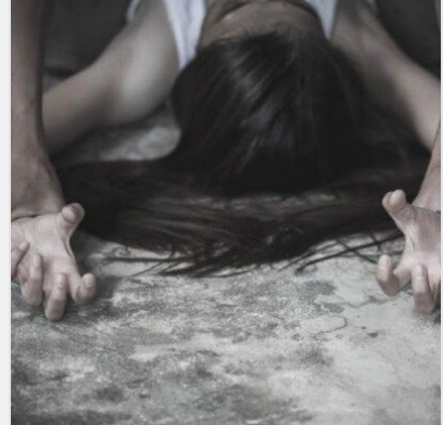
Катували та зґвалтували волонтерку: що відомо про чотирьох ..