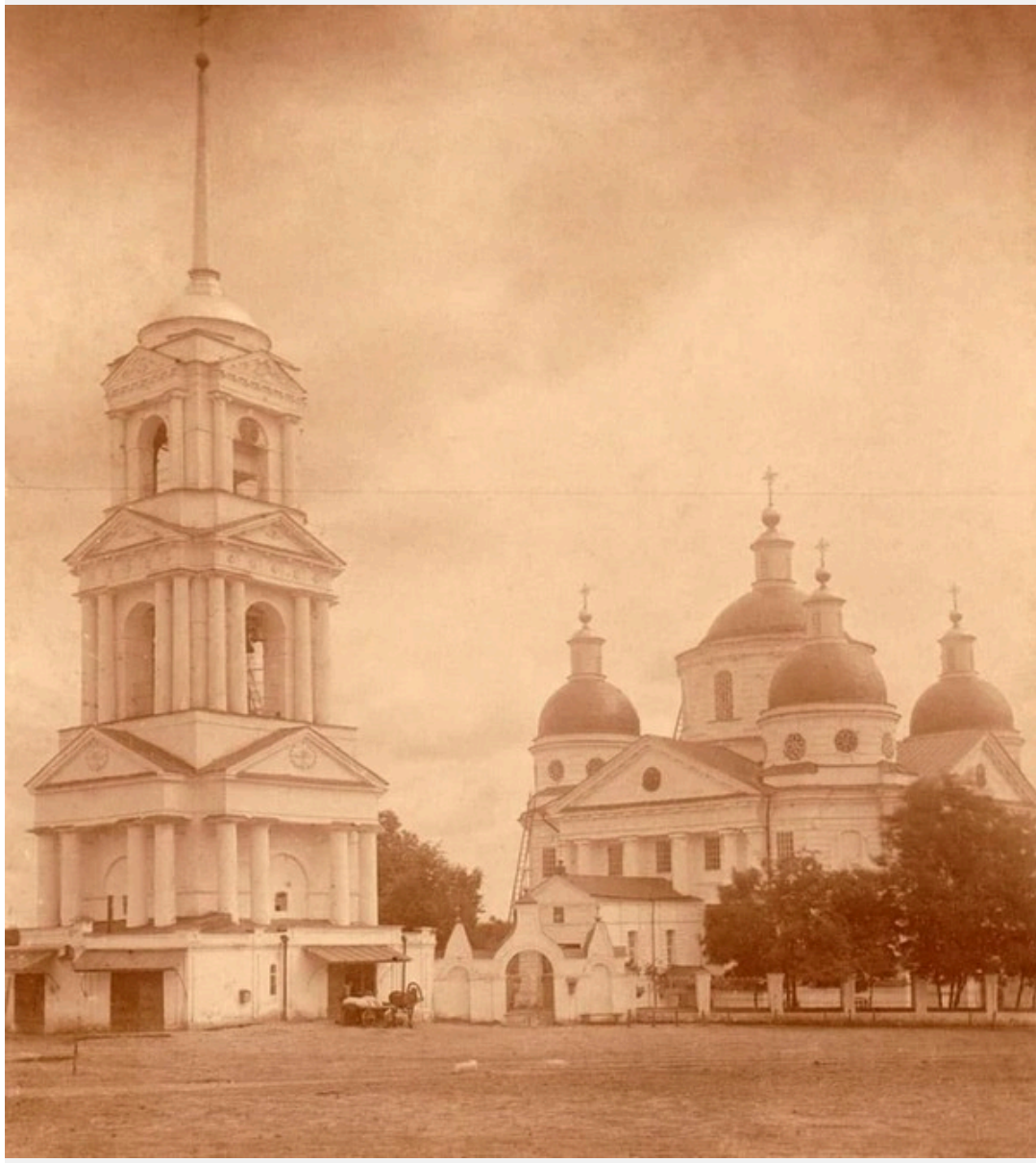
Храм Різдва Пресвятої Богородиці у 1914 році.