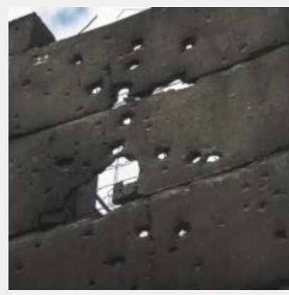
Як виглядає українська ТЕЦ, що пережила не одну ракетну атаку російських загарбників