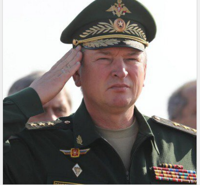
Хотів узяти Київ за три дні: російський генерал Лапін ..