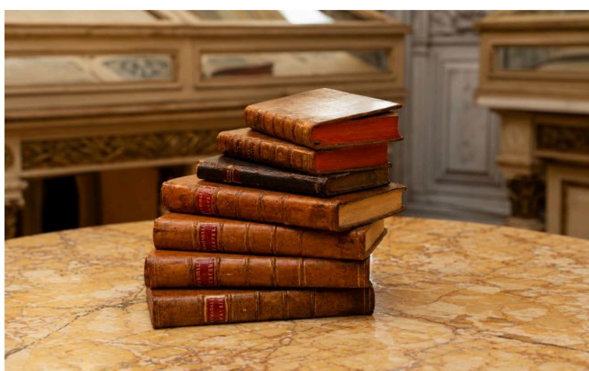
Фото: Книги, які передали до Національної бібліотеки України імені В. І. Вернадського

Не витрачай час на шум! Читай тільки суть з РБК-Україна у Google