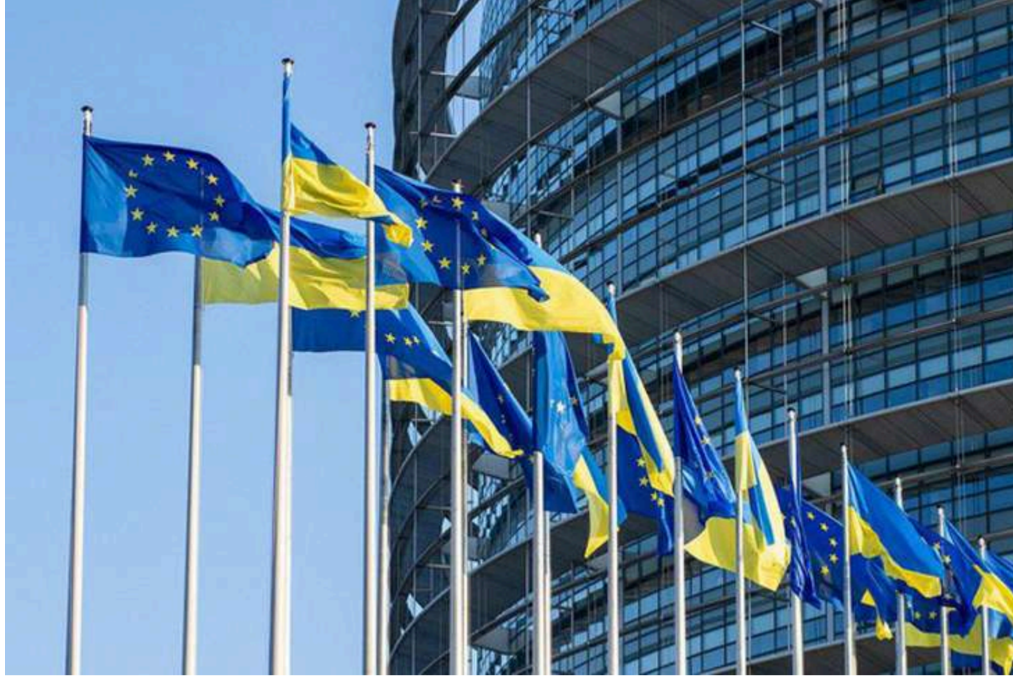
Ілюстративне фото з відкритих джерел

У Євросоюзі оголосили про початок підготовчих процедур для офіційного відкриття першого переговорного кластера в межах процесу вступу України та Молдови до ЄС. Про це повідомило Кіпрське головування в Раді ЄС.