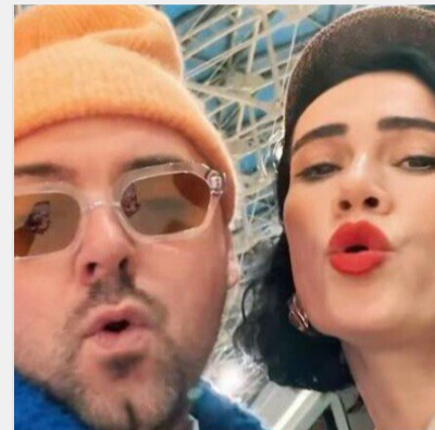
Як зараз живе дружина покійного соліста гурту ADAM і що ..