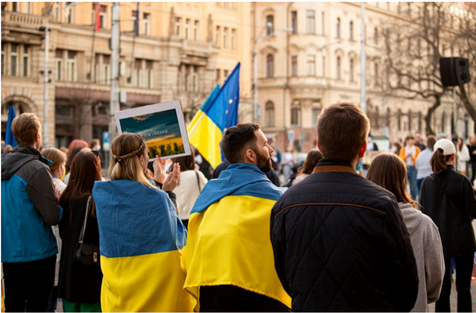
Українські біженці

КАРПЕЦЬ ОЛЕКСАНДР — 04 Червня 2026, 13:40 2 Mins Read — СВІТ