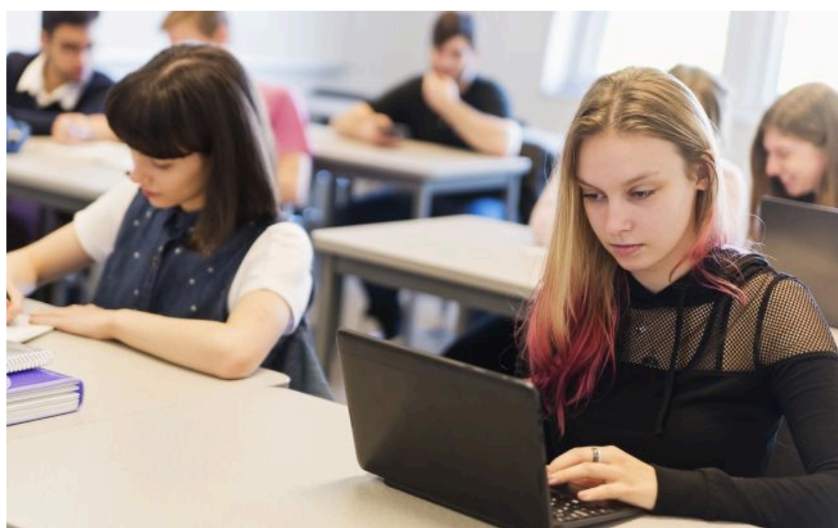
Тестування з математики - важливе з багатьох причин