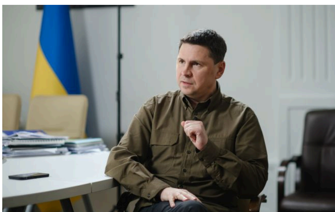
Фото: Михайло Подольак (Віталій Носач, РБК-Україна)

Розумій ситуацію на фронті через факти, а не чутки з РБК-Україна у Google