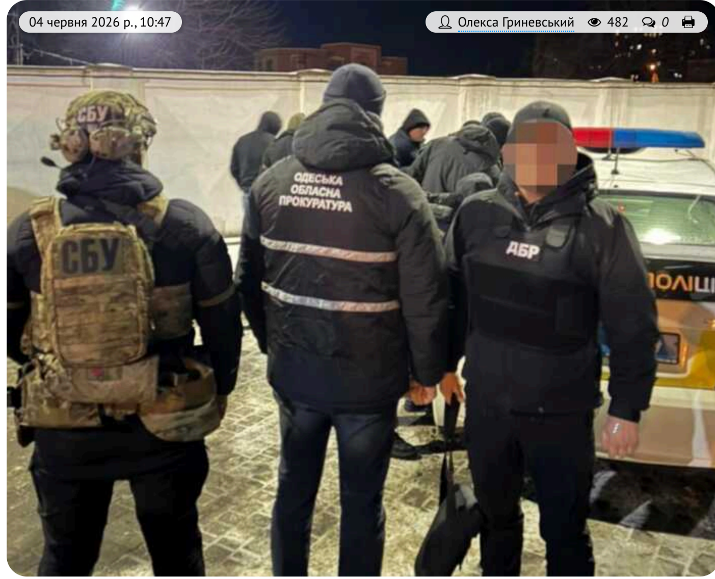
Від двох тисяч доларів за «свободу»: в Одесі судитимуть правоохоронців, які продавали відкуп від ТЦК

В Одесі до суду передали справу двох правоохоронців, яких обвинувачують у вимаганні грошей у військовозовов'язаних чоловіків. За даними слідства, вони зупиняли водіїв під час патрулювання та пропонували за гроші не доставляти їх до територіального центру комплектування. Вартість такої «послуги» стартувала від двох тисяч доларів.