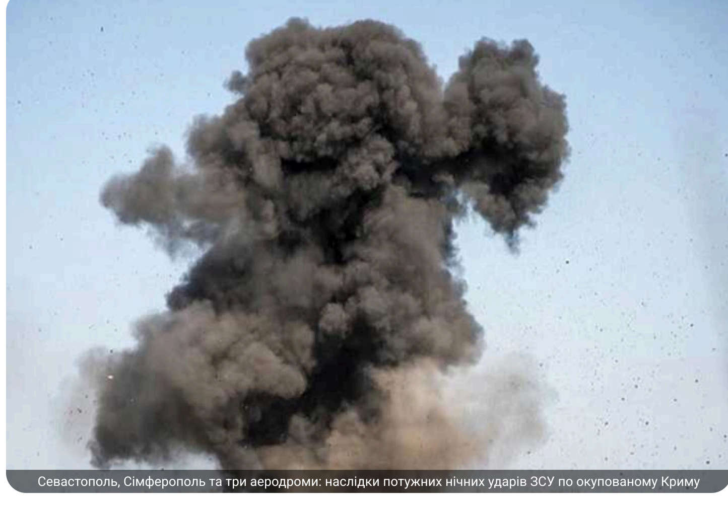
Севастополь, Сімферополь та три аеродроми: наслідки потужних нічних ударів ЗСУ по окупованому Криму

Тимчасово окупований росіянами Крим вночі 4 червня перебував під атакою Сил оборони України майже всю ніч. На півострові лунали вибухи, спалахнули пожежі та є загиблі. Під ударами були військові об'єкти та нафтобази російських окупантів, також росіяни перекривали Кримський міст.