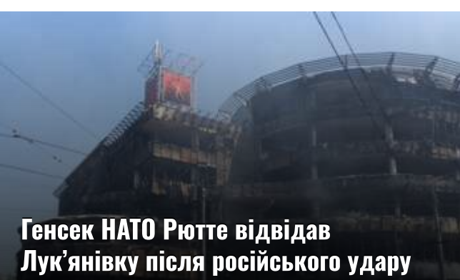
Генсек НАТО Рютте відвідав Лук'янівку після російського удару