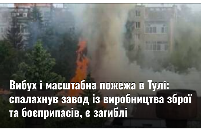
Вибух і масштабна пожежа в Тулі: спалахнув завод із виробництва зброї та боєприпасів, є загиблі