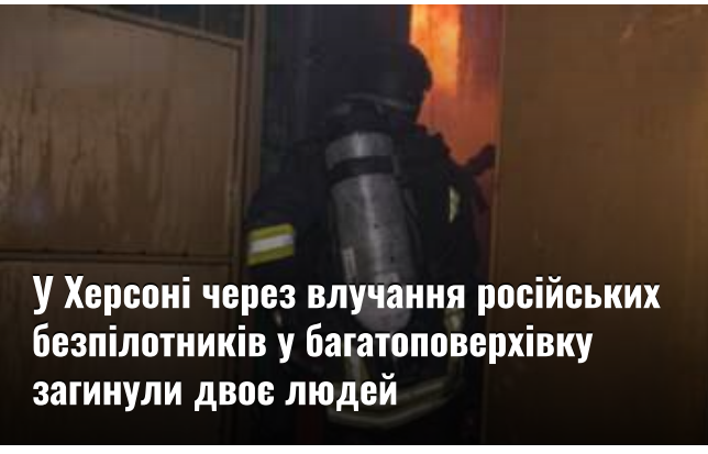
У Херсоні через влучання російських безпілотної у багатоповерхівку загинули двоє людей