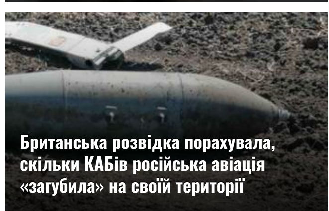
Британська розвідка поразула, скільки КАБів російська авіація «загубила» на своїй території