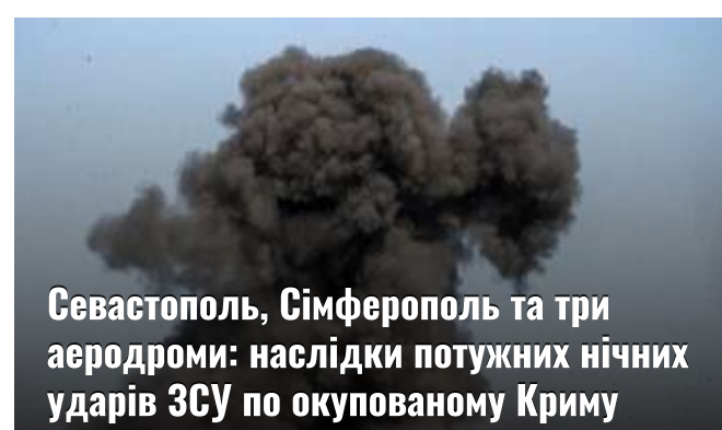
Севастополь, Сімферополь та три аеродроми: наслідки потужних нічних ударів ЗСУ по окупованому Криму