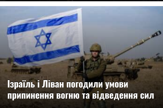
Ізраїль і Ліван погодили умови припинення вогню та відведення сил