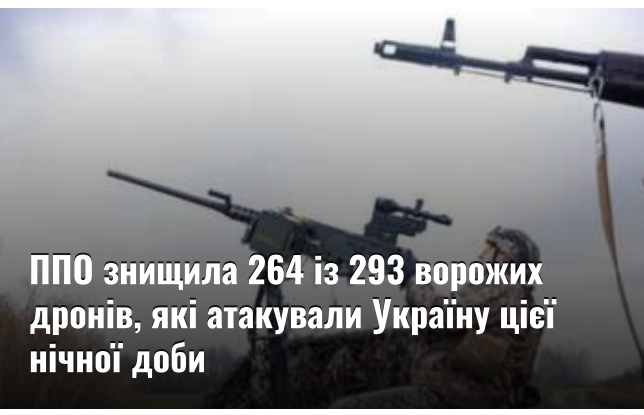
ППО знищила 264 із 293 ворожих дронів, які атакували Україну цієї нічної доби