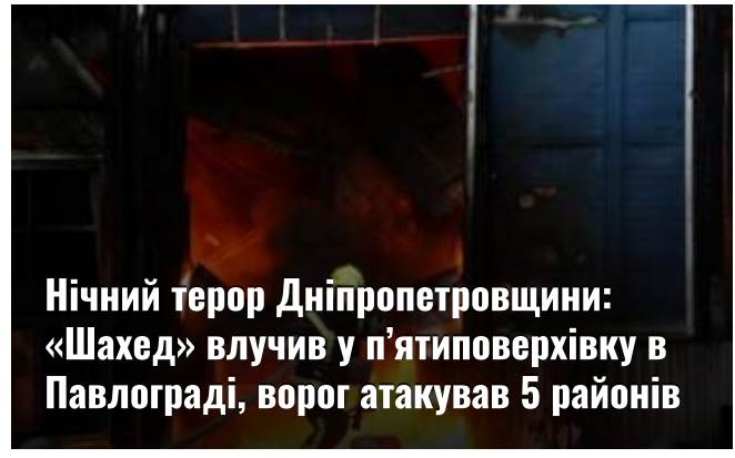
Нічний терор Дніпропетровщини: «Шахед» влучив у п'ятиповерхівку в Павлограді, ворог атакував 5 районів