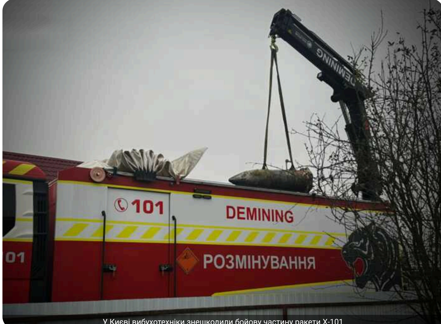
У Києві вибухотехніки знешкодили бойову частину ракети X-101

У Голосіївському районі Києва після чергової масованої атаки РФ рятувальники виявили бойову частину крилатої ракети X-101.