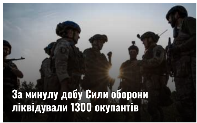
За минулу добу Сили оборони ліквідували 1300 окупантів