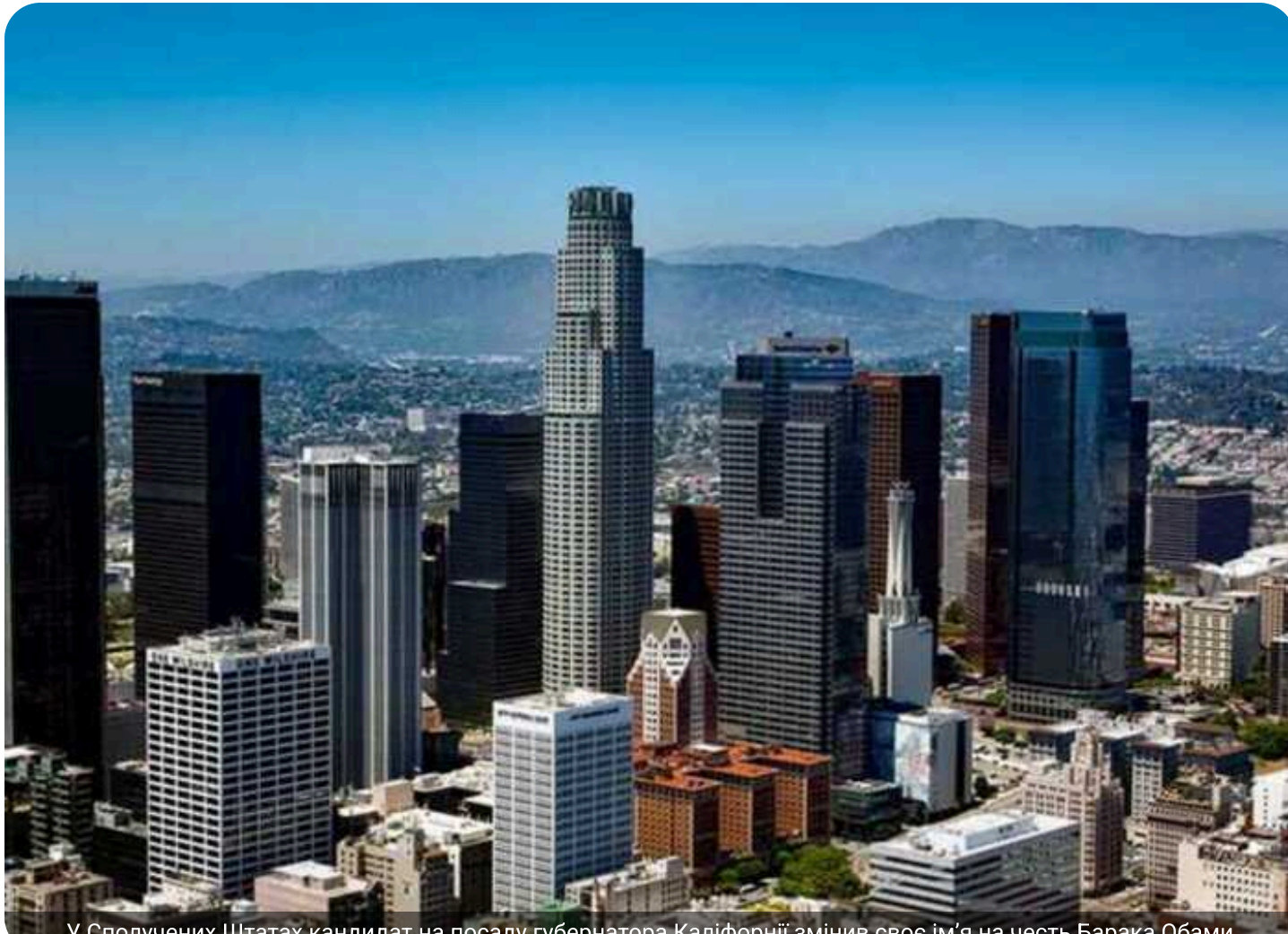
У Сполучених Штатах кандидат на посаду губернатора Каліфорнії змінив своє ім'я на честь Барака Обами

Жителі Каліфорнії зненацька побачили у списку кандидатів на посаду губернатора знайоме ім'я — Барак Обама. Проте йдеться не про колишнього президента США.