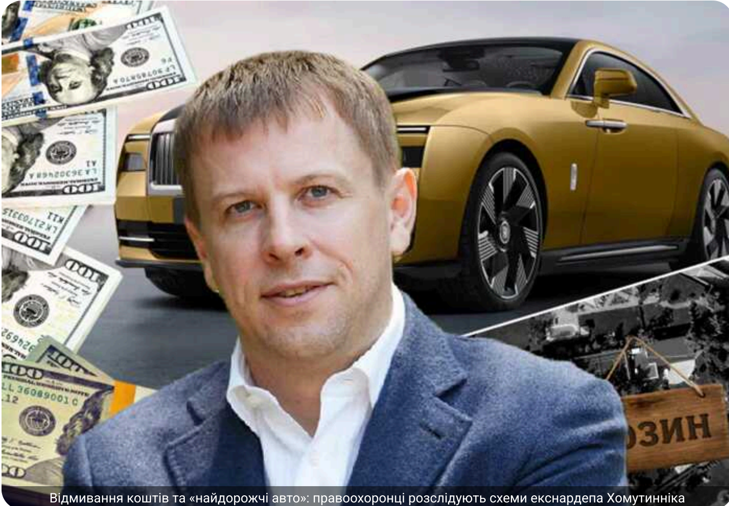
Відмивання коштів та «найдорожчі авто»: правоохоронці розслідують схеми екснардепа Хомутинніка

Головне слідче управління Нацполіції розслідує можливе відмивання коштів компаніями екснардепа Віталія Хомутинніка. Про підрозділий бізнес колишнього «регіонала» та експовно депутатської групи «Відродження» вже неодноразово писали ЗМІ.