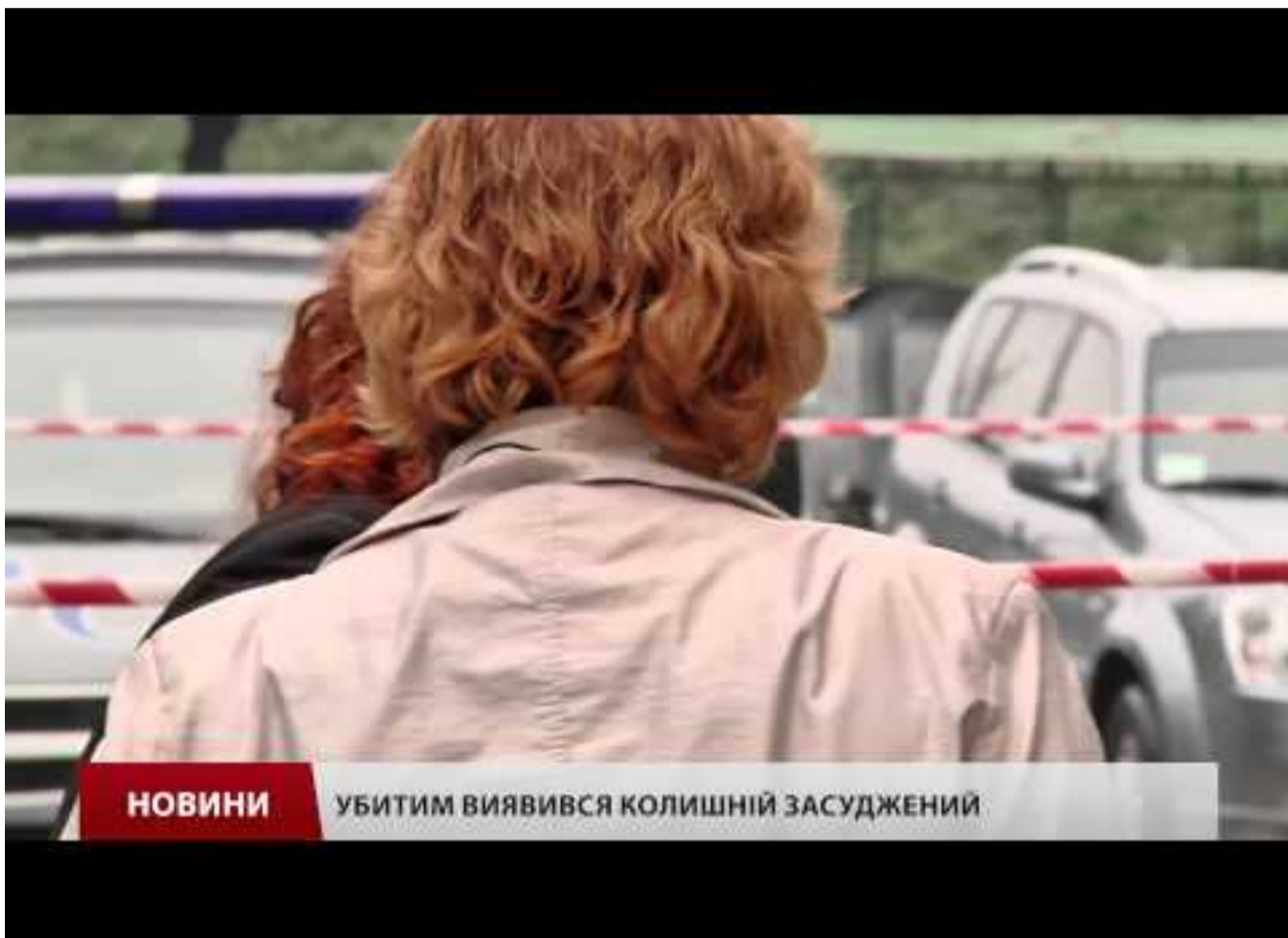
УБИТИМ ВИЯВИВСЯ КОЛИШНІЙ ЗАСУДЖЕНИЙ

Йдеться про події зразка 25 вересня 2015 року, коли парочка кілерів у камуфляжному одязі на автомобілі марки BMW з "військовими" номерами перестріла пана Мар'яна, що виходив із домівки на вулиці генерала Грекова. Зловмисники впритул розстріляли жертву з автомату "Скорпіон", випустивши дюжину куль. Від отриманих поранень Родич загинув на місці, а стрільці - наживали п'ятами.