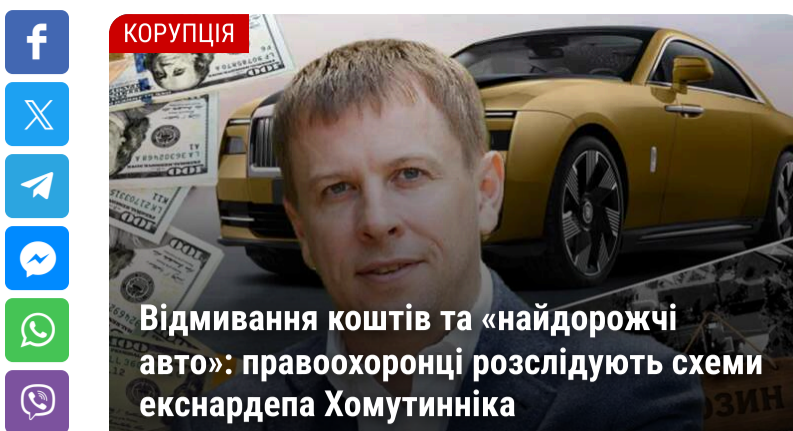
Відмивання коштів та «найдорожчі авто»: правоохоронці розслідують схеми екснардепа Хомутинніка

Ця компанія через закритий корпоративний інвестфонд "Каскад-Інвест" належить Віталію Хомутинніку. До речі, зараз екснардеп зареєстрований у Великій Британії (Лондон, Просвенор Гарденз М'юз Норг, 8).