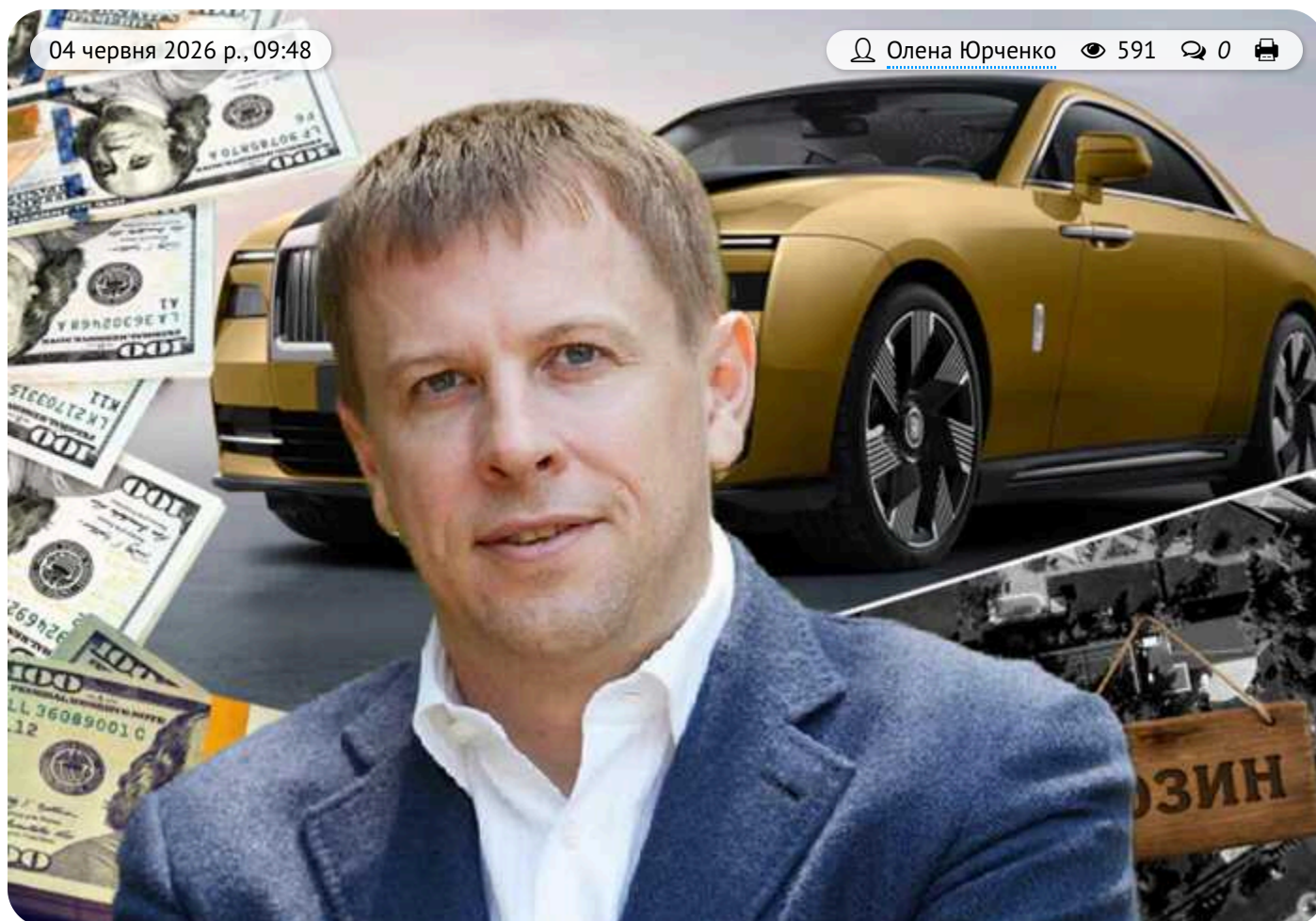
Відмивання коштів та «найдорожчі авто»: правоохоронці розслідують схеми екснардепа Хомутинніка

Головне слідче управління Нацполіції розслідує можливе відмивання коштів компаніями екснардепа Віталія Хомутинніка. Про підозрілий бізнес колишнього "регіонала" та ексгалови депутатської групи "Відродження" вже неодноразово писали ЗМІ.